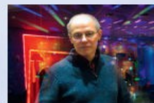
Музыкальное сопровождение - Станислав Иванчук