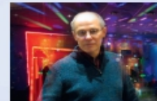
Музыкальное сопровождение- Станислав Иванчук