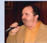
Эстрадные мелодии - в исполнении Феликса Кособурда