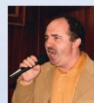
Эстрадные мелодии - в исполнении Феликса Кособурда